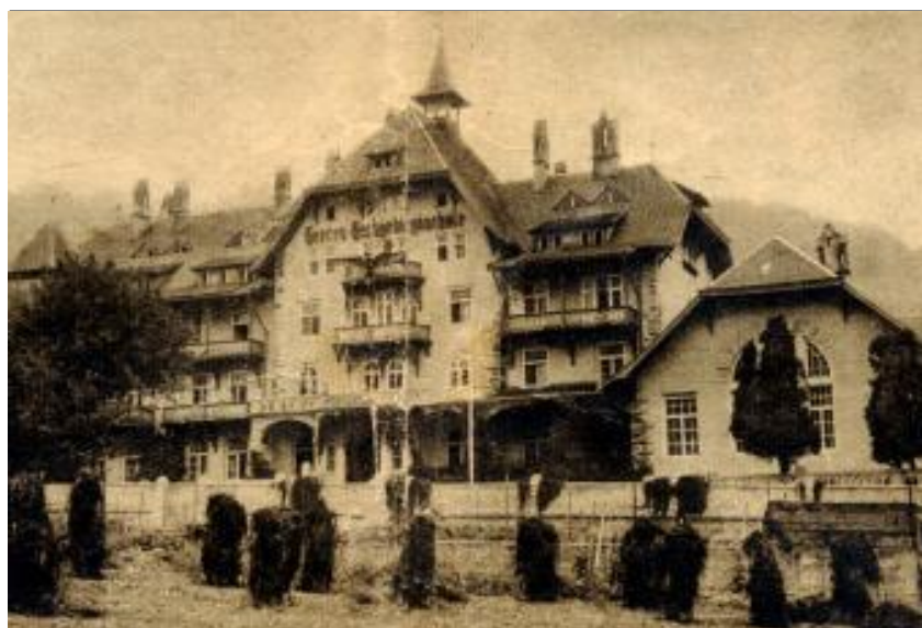
Heereshochgebirgsschule in Fulpmes - Stubaital

Bei der Aufstellung des Österreichischen Bundesheeres wechselte er die Uniform. Er war dann Kommandant des Jägerbataillons 22. Oberst Hofer übersiedelte 1963 zur Ergänzungsabteilung des Militärkommando Tirol, dessen Kdt er ab 1969 bis zu seiner Pensionierung 1978 war.