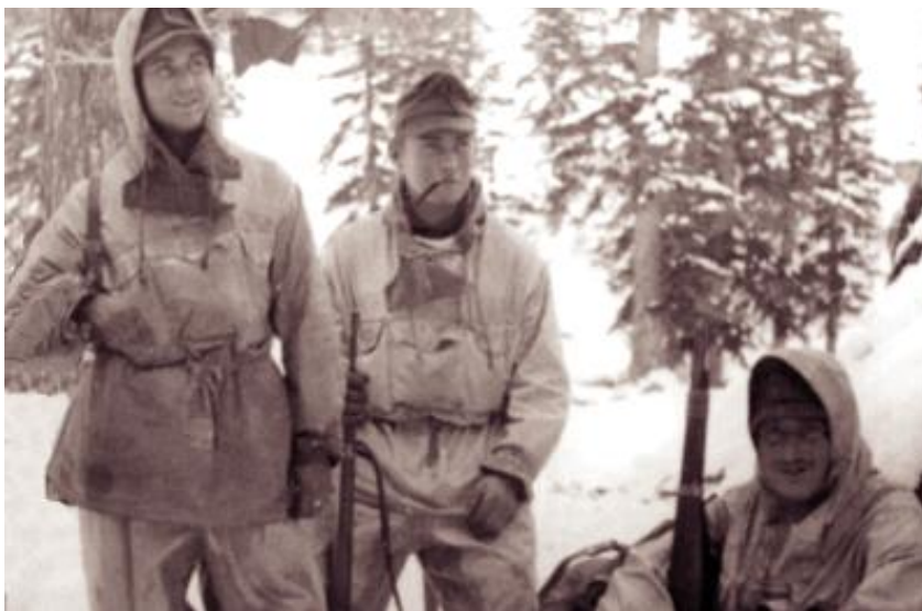
Unsere Winteradjustierung im Kaukasuseinsatz

Nach der Grobversorgung im Feldlazarett kam er auf das Lazarettsschiff Berlin und mit diesem in 12-tägiger Fahrt nach Kiel und dann nach Oldenburg.