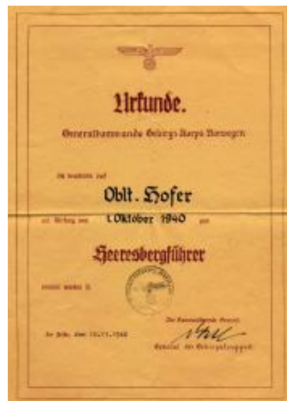
HBF Urkunde für Oblt. Hofer