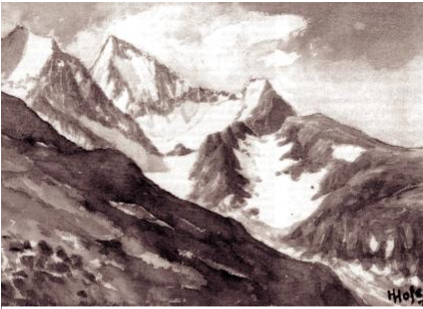
Angriffsgelände, rechts die Höhen J 120 und J 121

Wieder gefähig, verlässt er Oldenburg am 26. 8. und kommt zum Ersatztruppenteil nach Glasenbach, wo er eine Kompanie übernahm und im Winter Schikurse am Hochkönig abhielt.