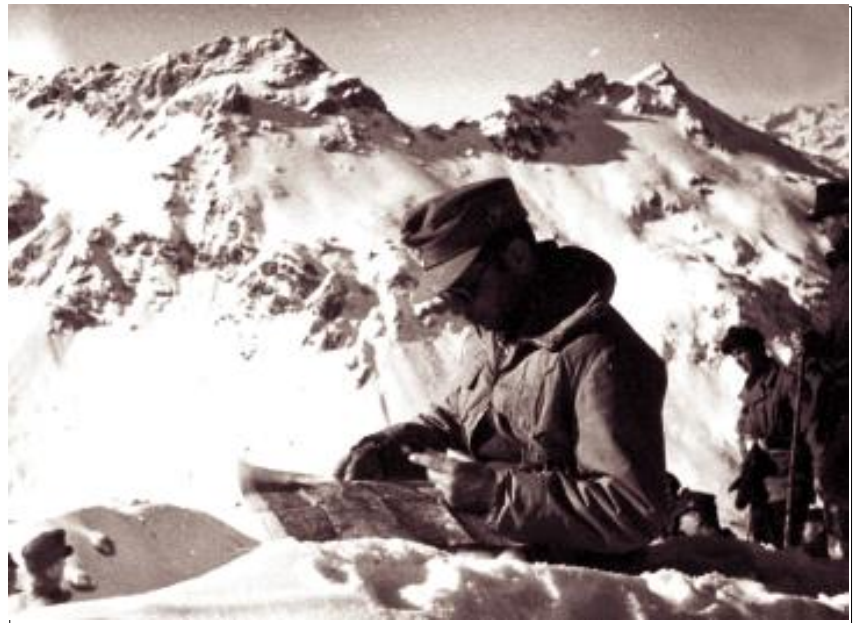
Alpin- und Waffenausbildung im Juli 1942 in der Wattener Lizum. Blick von der Grauen Wand Richtung Sonnenspitze

Am 22. 6. begann der Russlandfeldzug im Mittelabschnitt. Die Truppe erhält am 20. 6. den Auftrag zum Angriff nach Russland, Richtung Murmansk. Die Kp von Hptm Hofer wird als Voraus-