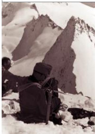
BF-Winterkurs im Zillertal

Die Ausbildung zum Heeresbergführer fand je nach Jahreszeit und Ausbildungsart in verschiedenen Gegenden der Alpen statt.